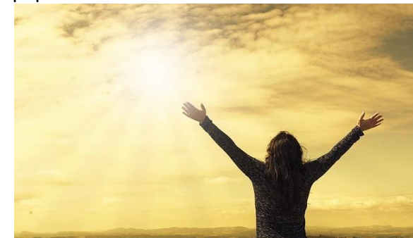
O objetivo da Antroposofia é o desenvolvimento dos potenciais humanos em sua liberdade

Estas fazem parte dos saberes antigos da Humanidade e foram reinseridas por Steiner em diferentes tipos de tratamento, renovando seu importante papel.