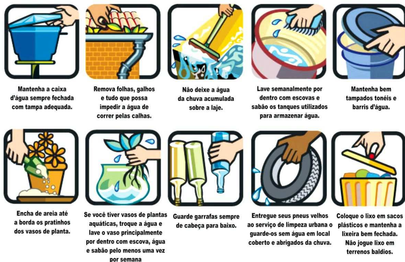
Figura 2. Esquema representativo de ações e medidas preventivas a serem desenvolvidas pela população para a eliminação de depósitos.

Por fim, é importante salientar que a finalidade das ações é manter a infestação do vetor em níveis incompatíveis com a transmissão da doença.