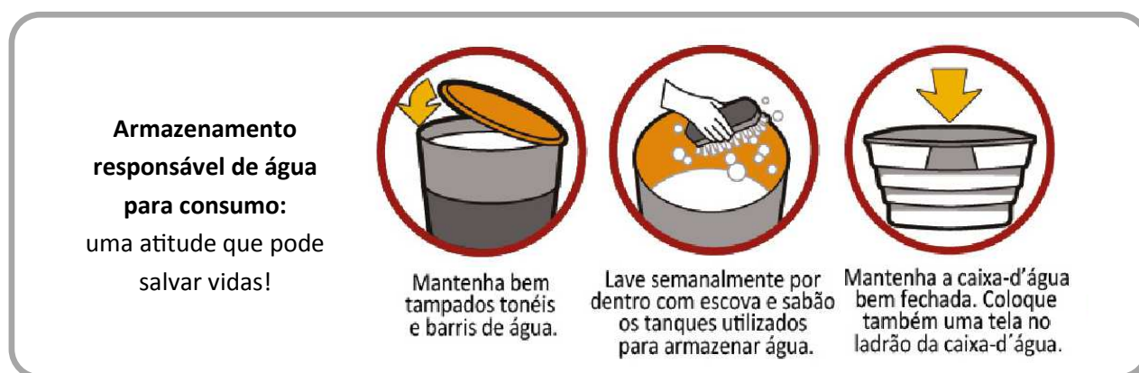
Figura 1. Esquema representativo de atitudes para armazenamento de água de maneira responsável.

Assim, é necessário que a população tome medidas urgentes para eliminar depósitos e arma-